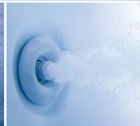
HK™16 Düsen leiten Wasserstrahlen gezielt auf die Rückenmuskeln. Durch eine Drehung am Düsenring können Sie Intensität und Richtung des Wasserstrahls bestimmen.