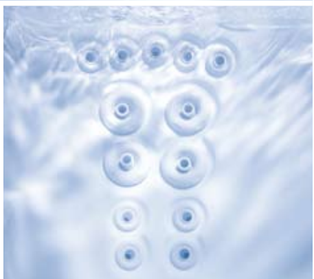
Erleben Sie die HK™40, HK™16 und HK™8 Düsen im tiefen Therapiesitz. HK™8 Nackendüsen sind oberhalb der Wasseroberfläche positioniert, um Nacken und Schultern punktgenau zu massieren.