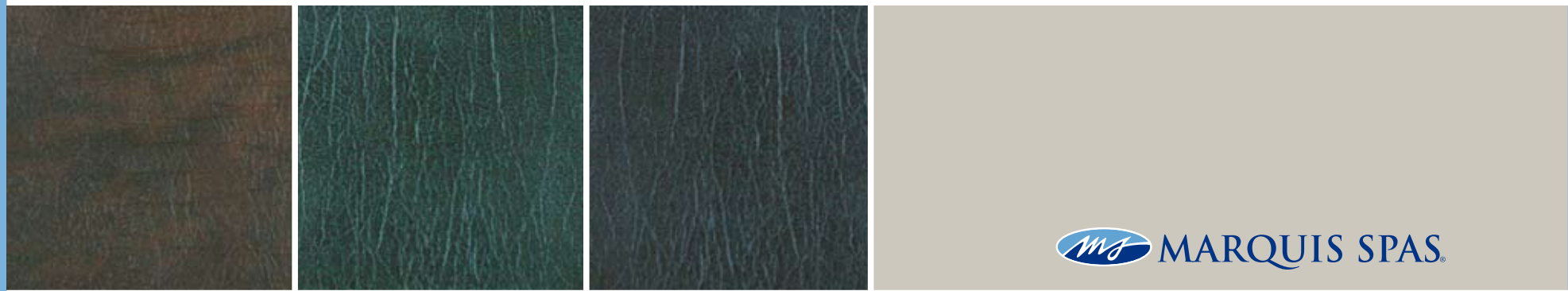
WILDWOOD COVER FOREST COVER CHARCOAL COVER