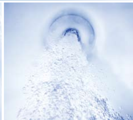
HK™12 Düsen bearbeiten die Problemzonen mit einem gezielten Wasserstrahl. Sinnvoll angeordnet bewirken sie so eine komplette Rückenmassage, wobei Intensität und Richtung der Wasserstrahlen variiert werden können.