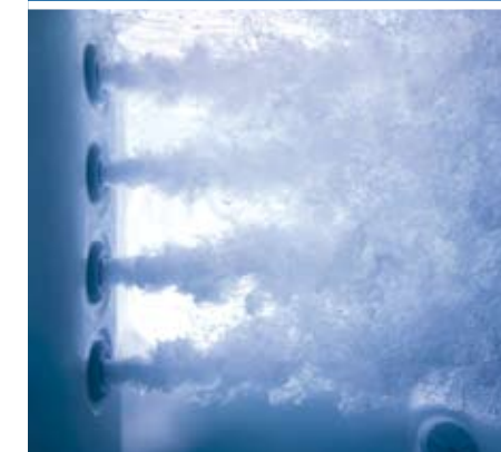
HK™40 Düsen sind in Gruppen angeordnet, um Rücken, Beine und Füße intensiv und tiefenwirksam zu massieren.