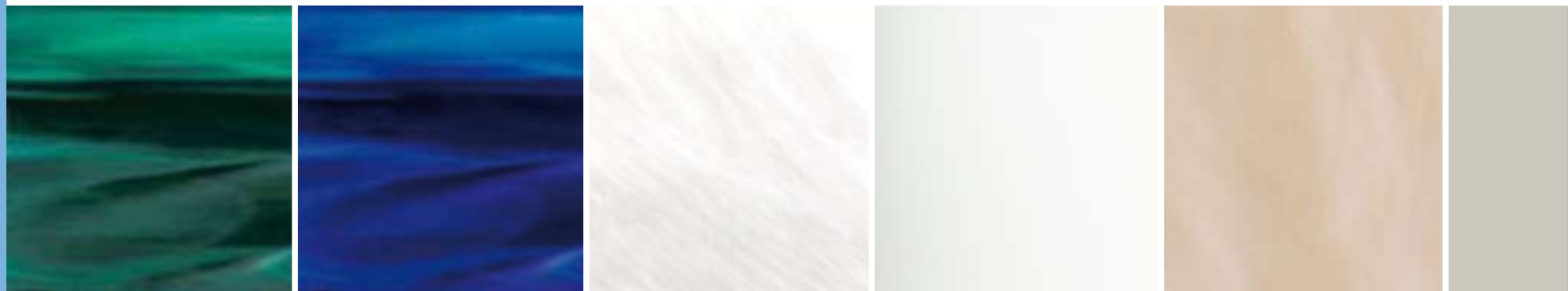
EMERALD SWIRL SAPPHIRE SWIRL SILVER SWIRL GLACIER DESERT HORIZON