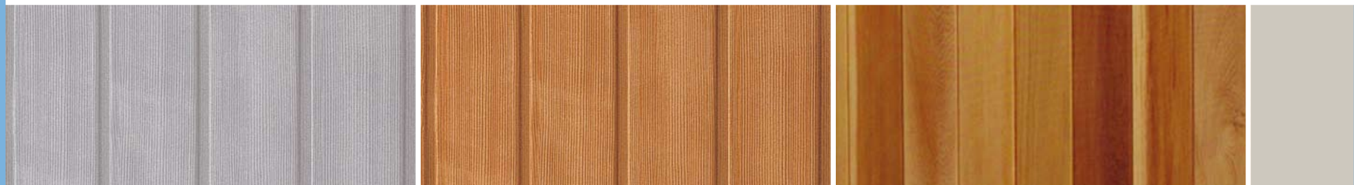
DURAWOOD DRIFTWOOD DURAWOOD CEDAR WESTERN RED CEDAR